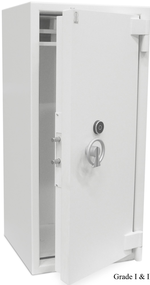
Grade I & II